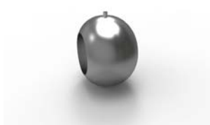
koncovka Říp 28 x 31 mm 20-0034-NF pár 150 Kč