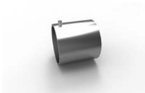
koncovka Váleček 18 x 25 mm 20-0030-NF pár 110 Kč