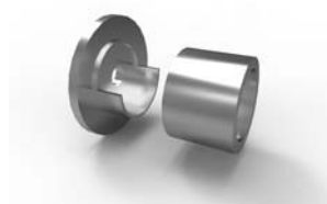
stěnový držák 39 x 23 mm 20-5000-NF ks 140 Kč