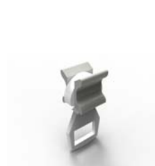
jezdec s teflonem 30-015 10 ks 20 Kč