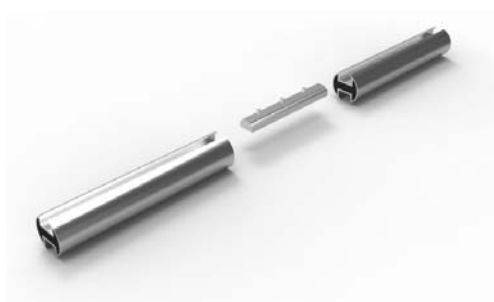
spojka profilů 20-1102 ks 100 Kč