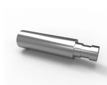
prodloužení držáku 20-5100-NF ks 90 Kč