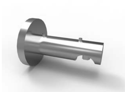
jednodržák 20-0600-NF ks 150 Kč 20-0620-NF pár 280 Kč