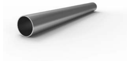
16-0120-NF trubka 120 cm ks 120Kč 16-0160-NF trubka 160 cm ks 160 Kč 16-0200-NF trubka 200 cm ks 200 Kč 16-0240-NF trubka 240 cm ks 240 Kč