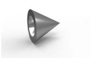
koncovka Ještěd 28 x 29 mm 16-0037-NF pár 100 Kč