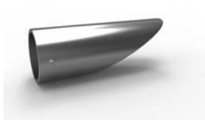
koncovka Klínovec 66 x 22 mm 16-0036-NF pár 100 Kč