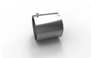
koncovka Váleček 22 x 20 mm 16-0030-NF pár 80 Kč