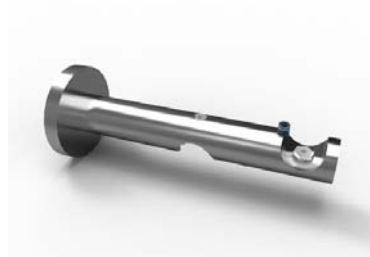
dvoudržák Triplex 80/140 mm 16-2800-NF ks 350 Kč 16-2820-NF pár 680 Kč