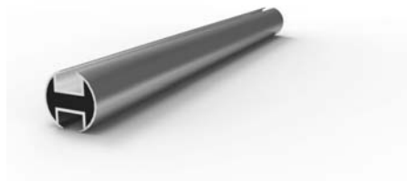
16-1012-NF profil 120 cm ks 290 Kč 16-1016-NF profil 160 cm ks 390 Kč 16-1020-NF profil 200 cm ks 510 Kč 16-1024-NF profil 240 cm ks 580 Kč 16-1040-NF profil 400 cm ks 1200 Kč