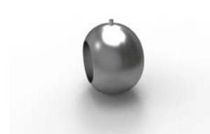
koncovka Říp 26 x 30 mm 16-0034-NF pár 100 Kč