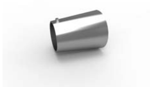
koncovka Kamenec 34 x 26 mm 16-0038-NF pár 120 Kč