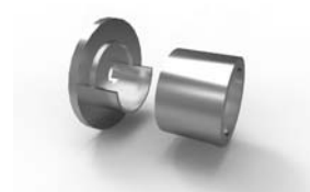
stěnový držák 34 x 21 mm 16-5000-NF ks 100 Kč